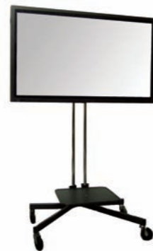
7DBH MONITOR PLASMA 32" + SOPORTE 32" PLASMA MONITOR + BASE