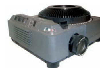
7DAA PROYECTOR DE DIAPOSITIVAS CARRUSEL. OBJETIVO ZOOM 70-120. BANDEJA 80 DIAPOSITIVAS (con mando a distancia) CARROUSEL SLIDE PROJECTOR. 70-120 ZOOM LENS. TRAY FOR 80 SLIDES (with remote control)