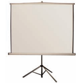
7DBT PANTALLA 180 x 180 CON TRÍPODE* 180 x 180 SCREEN WITH TRIPODE