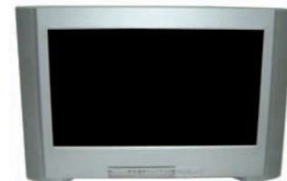
7DBG MONITOR 28" + SOPORTE 28" MONITOR + BASE