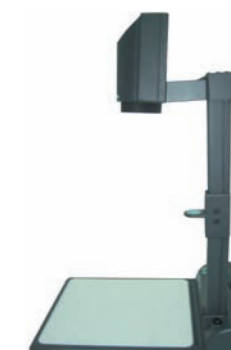
7DAB PROYECTOR DE DOCUMENTOS (WOLFFVISION) DOCUMENT VISUALISER (WOLFFVISION)