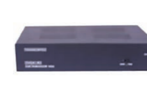
7DBL ESTACIÓN INTERCOM INTERCOM STATION