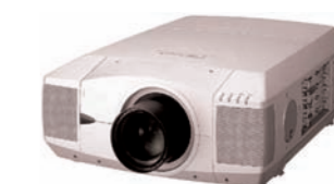
7DBR PROYECTOR SXGA 10000 LUX 10000 LUX SXGA PROJECTOR

Servicio en régimen de alquiler. Ver precios y condiciones del servicio en el formulario de Equipamiento Audiovisual. See rates and service conditions in the Audiovisual Equipment order form.