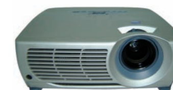
7DBN PROYECTOR XGA 1000 LUX 1000 LUX XGA PROJECTOR 7DBO PROYECTOR XGA 2200 LUX 2200 LUX XGA PROJECTOR 7DBP PROYECTOR XGA 3300 LUX 3300 LUX XGA PROJECTOR