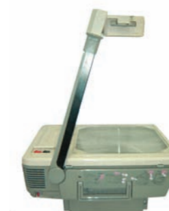
7DAC RETROPROYECTOR DE TRANSPARENCIAS 400 W OVERHEAD PROJECTOR 400 W 7DAD RETROPROYECTOR DE TRANSPARENCIAS 600 W OVERHEAD PROJECTOR 600 W