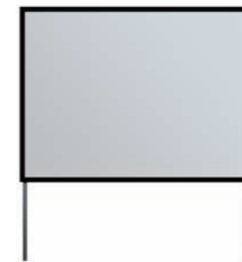
7DBU PANTALLA FRONTAL 240 x 180* FRONT 240 x 180 SCREEN