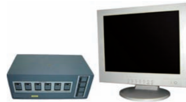
7DBE MONITOR TFT 15" + DISTRIBUIDOR SEÑAL VGA 15" TFT MONITOR + VGA SIGNAL DISTRIBUTOR