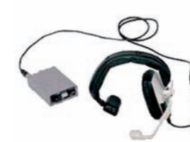
7DBM PUESTO MÓVIL DE INTERCOM ADICIONAL ADDITIONAL MOBILE INTERCOM STATION