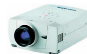
7DBQ PROYECTOR SXGA 5000 LUX 5000 LUX SXGA PROJECTOR